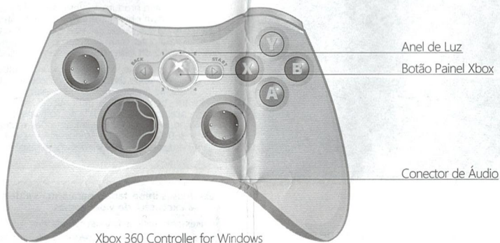
Xbox 360 Controller for Windows